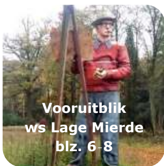
Vooruitblik ws Lage Mierde blz. 6-8