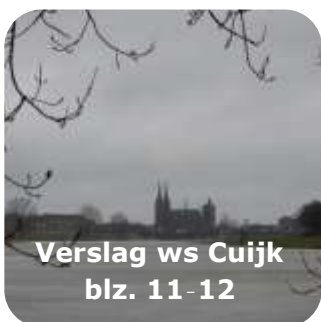
Verslag ws Cuijk blz. 11-12