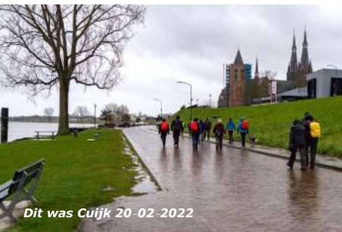
Dit was Cuijk 20-02-2022

Dat is wel ff doorbuffelen! De kerk van Cuijk zien we geruime tijd al liggen, maar de Maas zit nog tussen ons en de finish in.