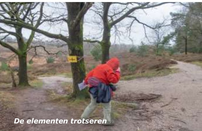
De elementen trotseren