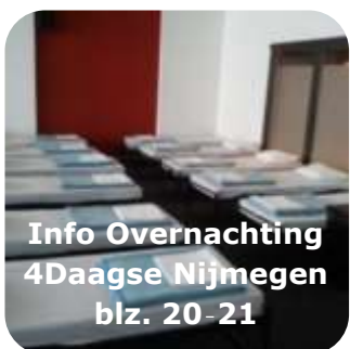
Info Overnachting 4Daagse Nijmegen blz. 20-21