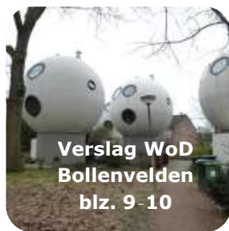
Verslag WoD Bollenvelden blz. 9-10