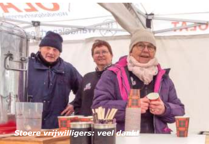
Stoere vrijwilligers: veel dank!