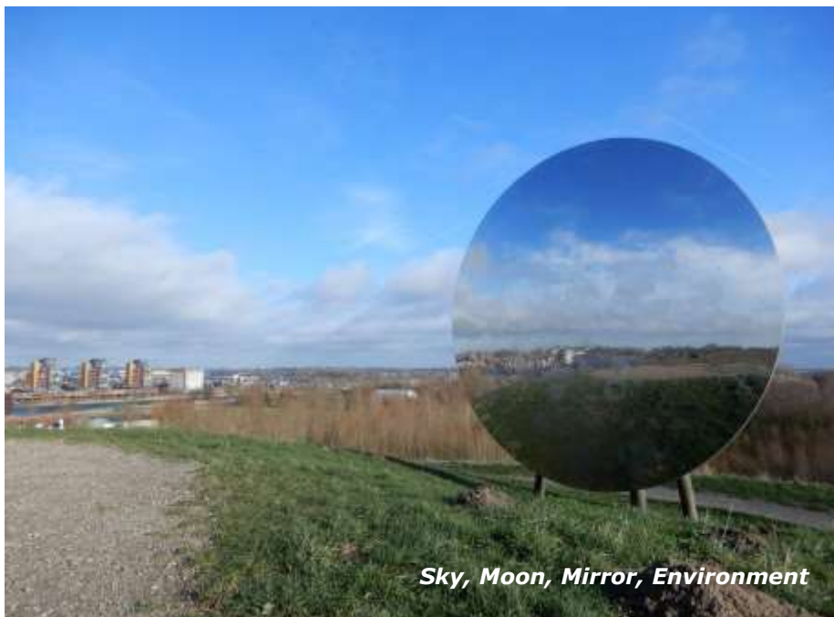
Sky, Moon, Mirror, Environment

genaamd Sky, Moon, Mirror, Environment uit 2006 te zijn.